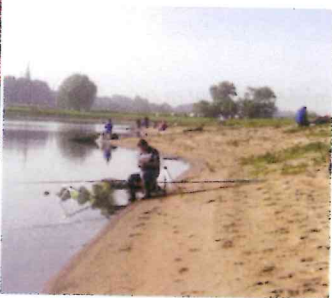
De wetgever legt de verantwoordelijkheid neer bij 'ieder die vist'.

Ben ik bezig met toezicht of met opsporing?