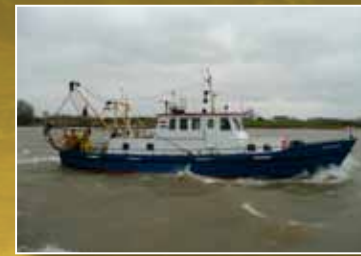
Onderzoeksschip Scholleveaar

De Vissenatlas Gelderland vormt een belangrijk naslagwerk en instrument voor het water- en natuurbeheer in relatie tot de vislevensgemeenschap. Daarnaast vormt de atlas voor een brede groep visliefhebbers een informatiebron over de herkenning, ecologie en het voorkomen van de zoetwatervisfauna in Gelderland. Dit zal voor velen een stimulans zijn om door te gaan met het