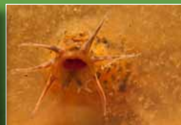
Grote modderkruiper