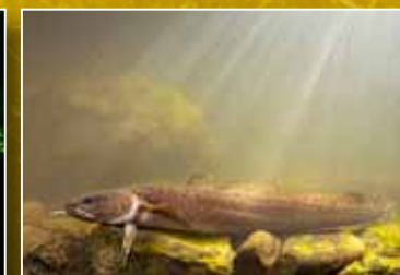
Kwabaal © Jelger Helder