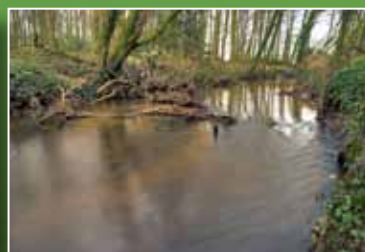
Habitat beekprik Boven Slinge