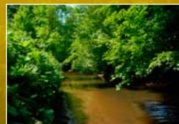
Stemperdink Boven Slinge

Profiteer van het intekenvoordeel. Tot 1 mei 2012 kost het boek slechts € 24,95