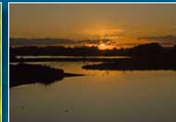
Oude Waal