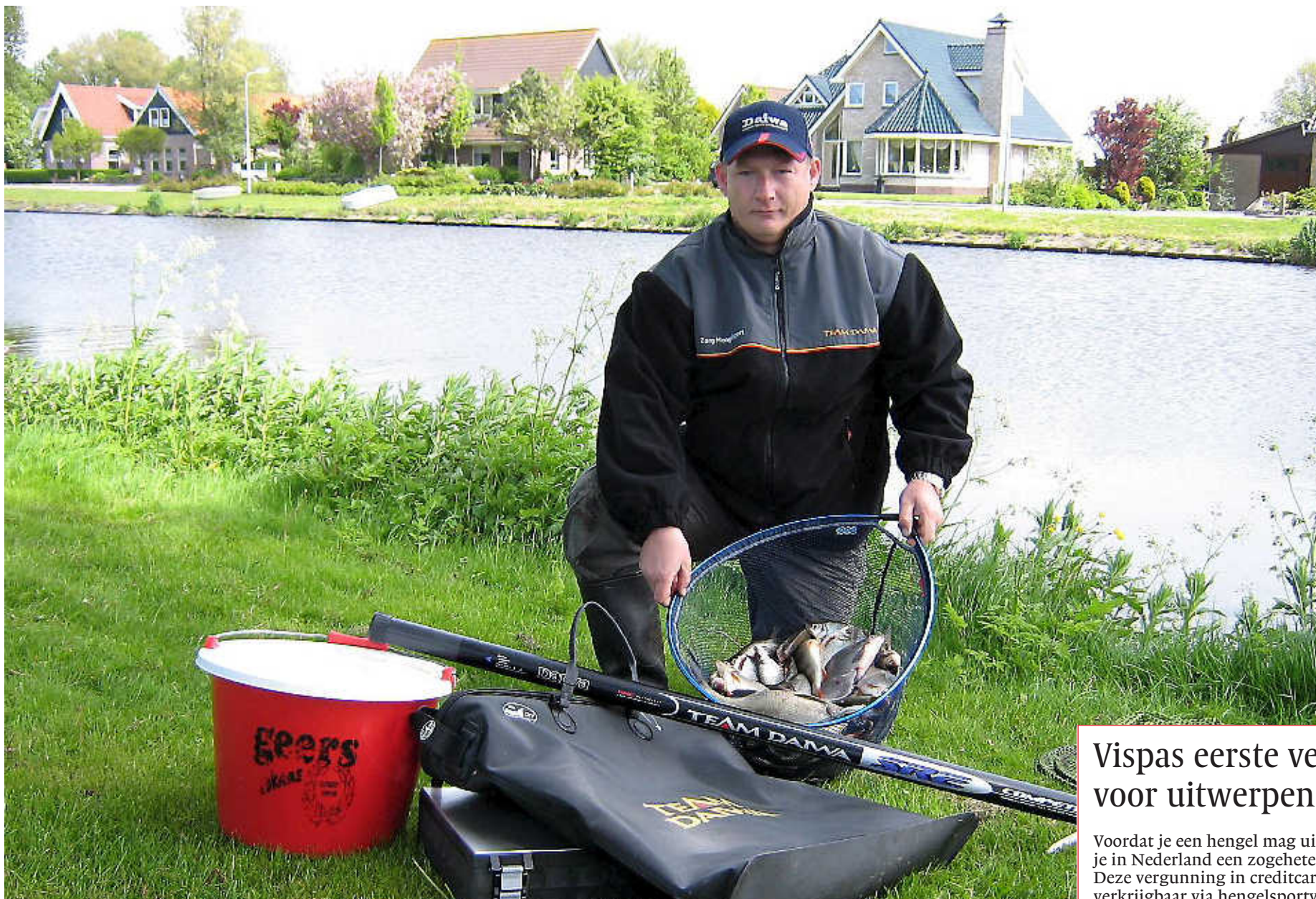
Nieuwedieper Jumpertz showt zijn vangst, brasems en voorns, bij het Noordhollandsch Kanaal in 't Zand.

Vischulst in Barsingehorn (210 leden), HSV Wieringen (180 sportvissers), De Eendracht in Burgerbrug, De Snoekbaars in 't