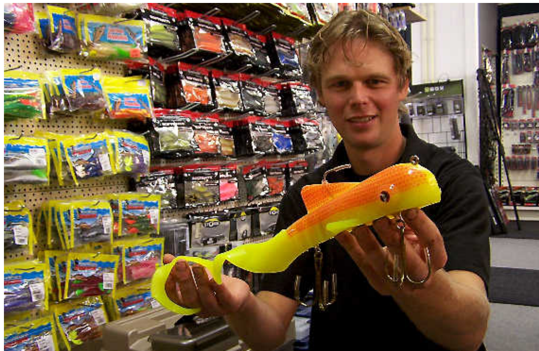
Pronk laat een nieuw, uit Amerika overgewaaid snuffje zien: de lokvis voor grote snoeken.

De kwaliteit van de spullen wordt steeds beter. Weet Zorg. „De meeste materialen zijn bijvoorbeeld lichter dan een paar jaar geleden.”