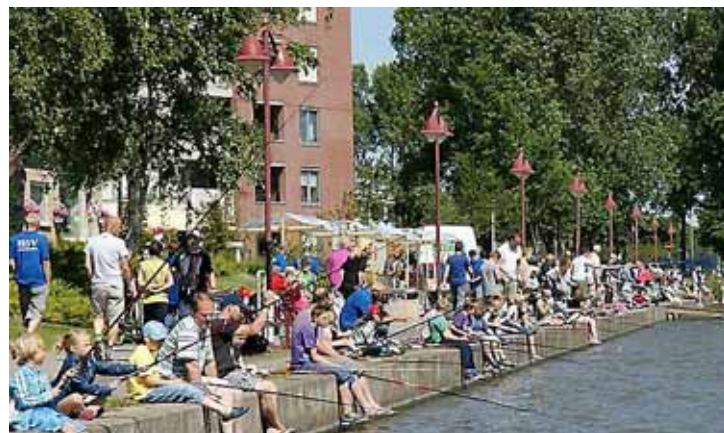
Jeugdvisdag bij HSV Den Helder.

Volgens Posthumus is baarsvissen (‘De Grote Sloot is mooi viswater’) pure concentratiesport. „Je moet er aanleg voor hebben, kunt niet verslappen. Zodat je rondkijkt of bent afgleid, mis je het goede moment om de vis aan de haak te slaan.”