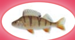
Baars - 22 cm