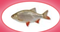
Riet-/ruisvoorn - 15 cm