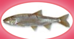
Serpeling - 15 cm