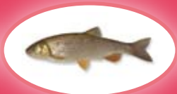
Kopvoorn - 30 cm

* bron- beek- en regenboogforel en beekrider