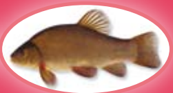
Zeelt - 25 cm