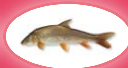
Barbeel - 30 cm