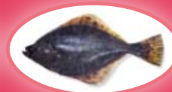
Bot - 20 cm