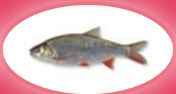
Winde - 30 cm