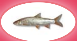
Sneep - 30 cm