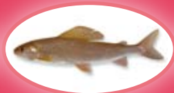
Vlagzalm - 35 cm