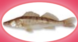
Snoekbaars - 42 cm