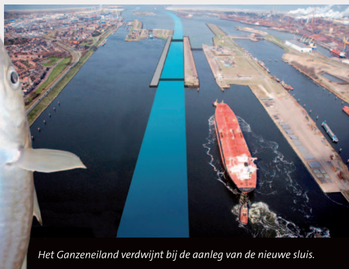
Het Ganzeneiland verdwijnt bij de aanleg van de nieuwe sluis.

natuurlijk dweilen met de kraan open.” Inmiddels is het droog geworden, al blijft de lucht dreigend.