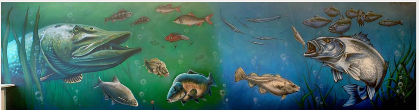
Detail van de vergaderzaal van Sportvisserij MidWest Nederland.