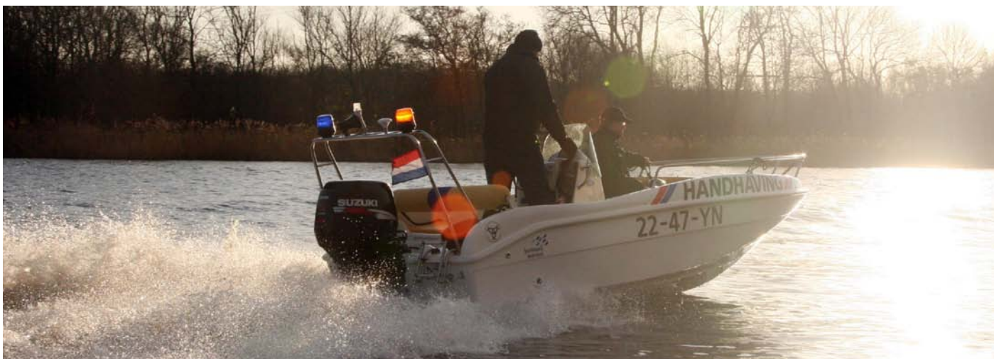
De komende tijd controleren we extra op en rond het Noordzeekanaal.

Begin dit jaar werd nabij het Noordzeekanaal in korte tijd twee keer een beroepsvisser betrap op het in bezit hebben van ondermaatse vis. Naar aanleiding hiervan heeft Sportvisserij MidWest Nederland besloten om extra te gaan controleren.