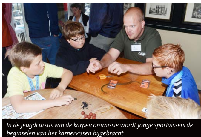
In de jeugdcurso van de karpcommissie wordt jonge sportvisseren de beginselen van het karpvissen bijgebracht.

De beroepsvisser die in januari al tegen de lamp was gelopen, had nu wederom ondermaatse snoekbaars in zijn bezit. Ook dit keer is proces-verbaal tegen hem opgemaakt en de vis in beslag genomen en vernietigd. Voorlopig blijven we extra controleren in het gebied, waarbij onder meer een boot wordt ingezet. Mocht je het vermoeden hebben dat er illegaal wordt gevist, laat het ons dan weten via: boa@sportvisserijmidwestnederland.nl .