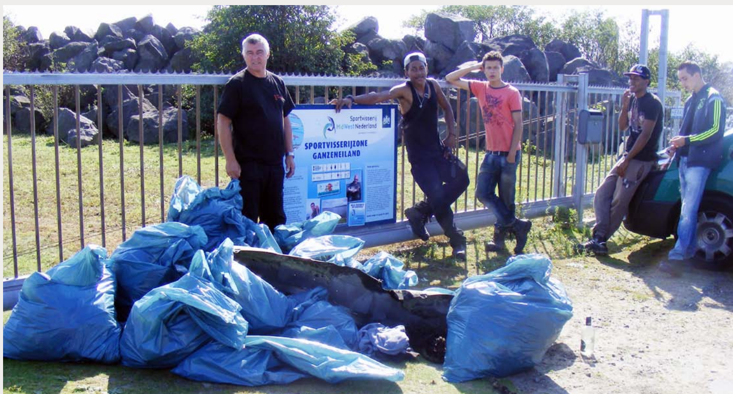
Het resultaat van een opruimactie bij het Ganzeneiland.

Randmeren – oktober: hotspots (onder de bruggen)